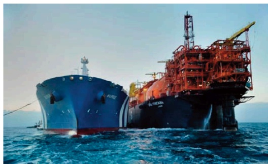
Il terminale galleggiante di rigassificazione "Fsr Toscana"

La gara avviata dalla società Olt Offshore Lng Toscana - informa una sua nota - ha avuto un significativo riscontro. Sono infatti pervenute, offerte da parte di ventuno diverse società e, tenuto conto dei li- (continua in ultima pagina)